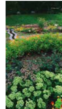
盛夏の日 [恵庭市/2018年8月] 日野 透 (札幌市中央区) えこりん村のガーデンを高所から俯瞰で撮る。雨続きの8月に、珍しく晴れ渡った日に感謝する。汗ばむ一日となった。