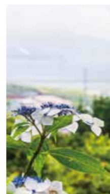
丘に咲く紫陽花 [せたな町/2018年8月] 水上 柳子 (黒松内町) 北海道では夏の花のイメージです。丘で満開でした。