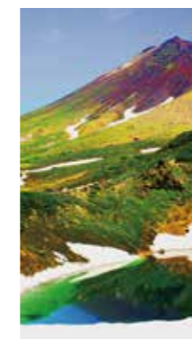
残り雪 [東川町 旭岳/2017年7月] 大口 芳子 (札幌市厚別区) 初夏の旭岳にはとほとほと雪が残り、涼しげな景観を作っていました。