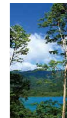
碧い湖水 [千歳市/2018年7月] 大口 雄一 (札幌市厚別区) 見慣れた湖水、でもこの日の水の蒼さと、黒と白のコントラストが爽やかに魅了させられました。