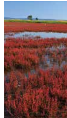
サンゴ草赤く [網走市 能取湖/2016年9月] 狩野 隆 (札幌市豊平区) 復活した能取湖のサンゴ草の赤が、青空に映えた。