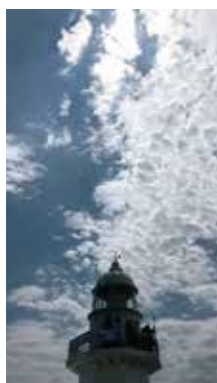
海の日 [室蘭市/2018年7月] oshimugi (伊達市) 毎年海の日には地球岬灯台の一般開放を行い、沢山の人が訪れています。その時の一コマ。