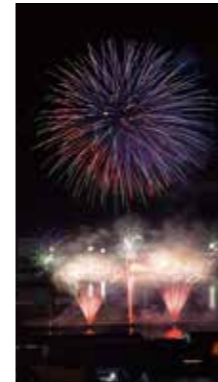
小樽の花火 [札幌市 金山/2017年7月] 長友 逸郎 (札幌市手稲区) 毛無山より撮影。