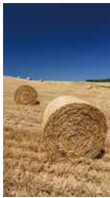
丘の牧草ロール [上富良野町/2018年7月] 狩野 隆 (札幌市豊平区) 刈り取られた牧草ロールが、大きなパウムクーヘンのように見えた。