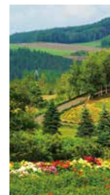
丘への小道 [美瑛町 せるぶの丘/2018年8月] 大口 はるみ (札幌市厚別区) 帰り道にふと目にして立ち寄った、せるぶの丘。また一つ楽しい場所を見つけた。