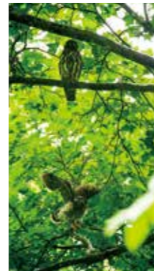
頑張りー! [三笠市/2018年7月] 坂口 正剛 (江別市) 上下の枝にとまったアオバスの親子、幼鳥がためらいがちに母親のいる枝へ移ろうとする姿に思わず「頑張りー!」とつぶやいてしまいました。