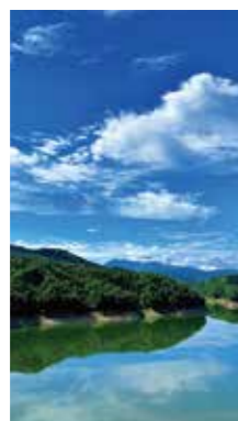
深緑の大雪山湖 [上川町 層雲峡/2018年8月] 永井 和子 (旭川市) 青空で程良い雲が流れておりました。湖面の水鏡が美しく、遠方に大雪山連峰が見えております。