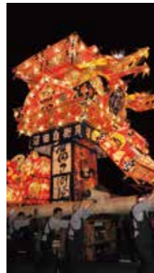
夜高あんどん [沼田町/2017年8月] 沼田自衛隊の夜高あんどんが、会場に向けて行進して来ました。