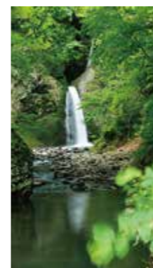
星置の滝 [札幌市 金山/2018年9月] 色づき始めた周りの木々に、秋の気配を感じる「星置の滝」です。