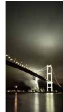
室蘭夜景 [室蘭市/2018年7月] 芳賀 茂俊 (恵庭市) 室蘭夜景の定番はここからがいいネ!