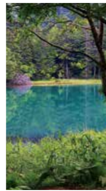
オンネトーの静寂 [足寄町/2018年7月] 青山 しおり (帯広市) 鏡のような水面が美しく、藍、青、碧、黄緑etc...のグラデーションを映し出します。