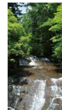
爽やかな流れ [恵庭市/2018年7月] 大口 雄一 (札幌市厚別区) 爽やかな新緑に見守られて流れ落ちる、小さな滝。心洗われる思いで水と対面しました。