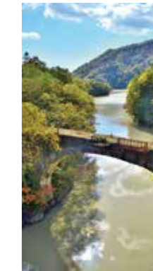
第三音更川橋梁 [上士幌町/2017年9月] 鈴木 章勝 (札幌市北区) 旧国鉄土幌線の橋梁です。紅葉した木々や雲を映した音更川をまたいだアーチ状の橋は、とても美しい眺めです。