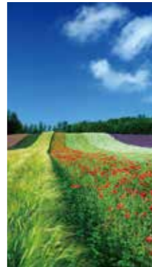
初夏の彩り [中富良野町/2018年7月] 近藤 俊六 (江別市) 花の景色とラベンダーの香りに思わず、身体と心が引き寄せられました。