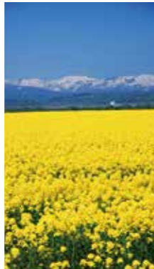
幸せの黄色 [滝川市 江部乙 / 2018年5月] 原田 芳昭 (札幌市西区) 菜の花の黄色の丘と、残雪の山並みが印象的でした。