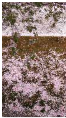
こぼれ桜 [札幌市 旧軽川緑地 / 2018年5月] 早瀬 正 (札幌市手稲区) 苔の上に散った桜の花びらがとても美しく、和の風情を感じました。