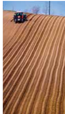
アートな畑 [美瑛町 / 2018年4月] 近藤 成美 (江別市) 丘陵地を耕したトラクターの線は、芸術作品のように見えました。