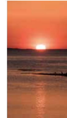
サロマ湖に沈む夕日 [常呂町 栄浦 / 2018年5月] 木本 洋 (札幌市西区) 私には四角に見えました。