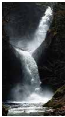
雪解けの「星置の滝」 [札幌市 金山 / 2018年5月] 早瀬 正 (札幌市手稲区) 雪解けの時期は、普段は穏やかな「星置の滝」も、ダイナミックな滝に変身します。