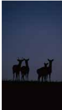
夜明け前の鹿 [別海町 中春別 / 2018年4月] 松井 繁男 (別海町) 日の出の1時間前後は、鹿の行動が活発になり、路上の横断が多くなります。