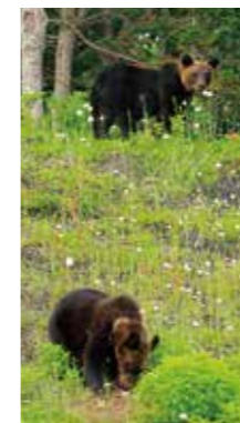
ヒグマの親子 [斜里町 / 2015年6月] 中澤 美津子 (札幌市厚別区) 道路脇ののり面に現れたヒグマの親子にビックリでした。