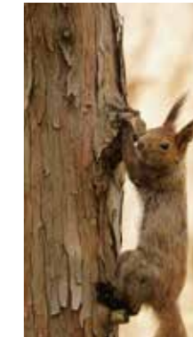
目が合っちゃったね [札幌市 円山公園 / 2018年4月] 美紗 (札幌市豊平区) パーベキューで盛り上がる園内で、やっと見つけたエゾリスちゃんと目が合いました。