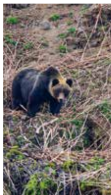
知床の春 [羅臼町 知床半島 / 2018年5月] 釜澤 まつみ (札幌市白石区) ヒグマが山の斜面でフキノトウを食べていました。