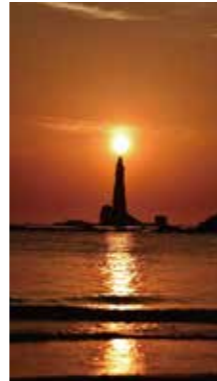
ローソクの灯り [余市町 / 2018年4月] 坂口 正剛 (江別市) 5月後半に近くの浜から見える観音岩(ローソク岩)、朝日が岩の頂上に重なる瞬間は、まるでローソクに火が灯ったように見え感動します。