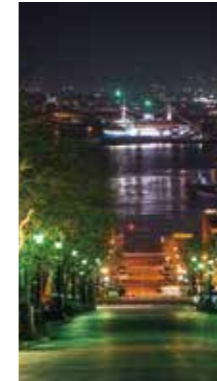
函館八幡坂からの夜景 [函館市 八幡坂 / 2018年4月] 木本 洋 (札幌市西区) 函館港に摩周丸。