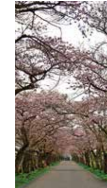
戸切地陣屋跡の桜並木 [北斗市 / 2018年4月] 芳賀 茂俊 (恵庭市) この桜並木は上磯峠下から、松前藩陣屋跡へ続く800mの桜のトンネルである。歴史を裏付ける見事な桜だ!