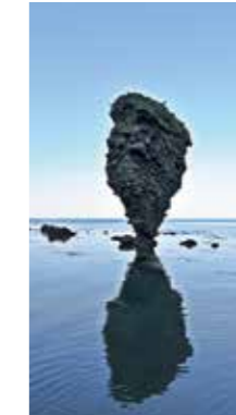
静かに佇むえびす岩 [余市町 白岩町 / 2018年5月] 芳賀 茂俊 (恵庭市) 岸から10数メートルほどの浅瀬に静かにそびえ立つえびす岩。風雪に耐え抜いた姿は美にいい!