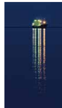
光騎 [室蘭市 / 2016年6月] 中澤 美津子 (札幌市厚別区) 港に停泊中の船の明かりが海上に長く伸びて美しかったです。