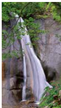
新緑の滝 [札幌市 滝野すずらん丘陵公園 / 2018年6月] 宮下 征治 (札幌市中央区) 滝野すずらん丘陵公園にある滝の滝は、美しい色合いとなって落ちていました。