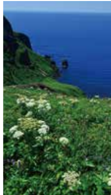
紺碧の海に [礼文町 / 2016年6月] 狩野 隆 (札幌市豊平区) 桃岩展望台の遊歩道から見る日本海に「猫岩」が印象に残った。