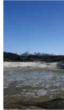
春の湖、春の山 [上川町 大雪ダム/2017年5月] 杉本 真也(札幌市手稲区) 5月と言えどまだまだ寒い北海道。湖の雪融けは、もう少し先のようです。