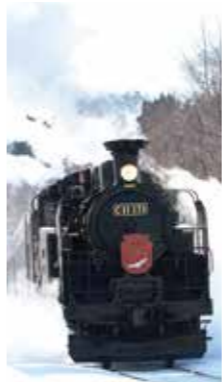
迫力の温原号 [標茶町/2017年11月] 能登 喬也(札幌市厚別区) 気温が氷点下の中、煙をたくさん出して走行するSL温原号です。