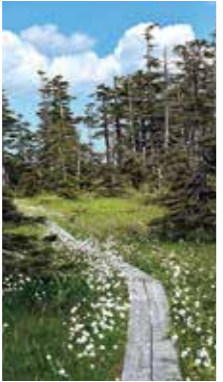
綿毛の松山湿原 [美深町/2016年6月] 永井 和子(旭川市) 道北の奥地に有る高層湿原で、アカマツやハイマツがオブジェの様。ワタスゲが一面に広がり、次の出番を待っているように見えます。