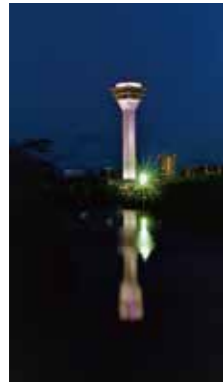
五稜郭タワー [函館市/2017年5月] 宮下 征治(札幌市中央区) 公園の堀に映るタワーは美しかった。