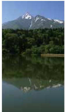
水面穏やか [札幌市 旧中の川堤防/2017年6月] 狩野 隆(札幌市豊平区) 朝の堤防の水面に、残雪の利尻山の姿が映し出された。