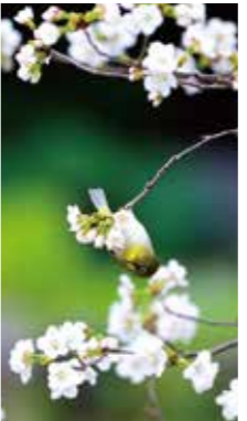
チシマザクラとメジロ [札幌市/2017年5月] 遅く開花するチシマザクラにメジロが集中して蜜を吸いにきた。