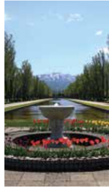
早春のカナール [札幌市/2017年5月] いとう しんじ(札幌市厚別区) 手稲山の残雪・カナール両側にある新緑のポプラ並木に春の花が彩りを添えた風景に北海道の雄大さを感じてシャッターを押す。