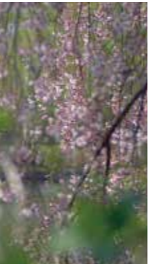
枝垂れ桜 [札幌市 豊平公園/2015年5月] 佐藤 昌弘(札幌市厚別区) 公園内を散策していたら、枝垂れ桜が風で揺れていました。