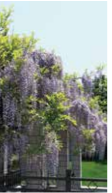
藤爛漫 [札幌市 前田森林公園/2017年5月] Y.やまこし(札幌市西区) 藤の花房が垂れ下がり咲き乱れて見事でしたのでパチリ!