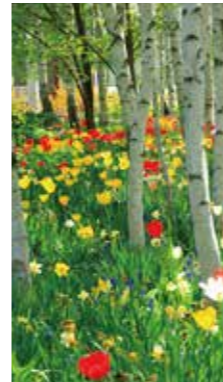
木立の花々 [旭川市/2017年5月] 大口 雄一(札幌市厚別区) 冬から目覚めた花々が、木立の中で咲き誇っていました。