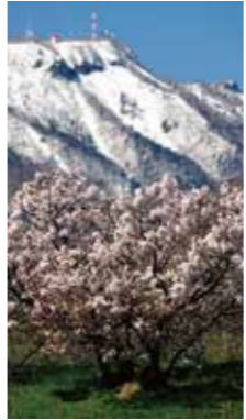
小さな桜の木 [札幌市 旧中の川堤防/2017年5月] 早瀬 正(札幌市手稲区) 今年も残雪の手稲山をバックに満開の「小さな桜の木」が、通りかかると人達に癒しの香をプレゼントしていました。