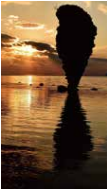
感動の朝 [余市町/2017年4月] 坂口 正剛(江別市) 穏やかな海岸に雲間から朝日が差し込み神秘的な瞬間に出逢うことができました。