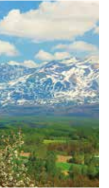
残雪模様 [美瑛町/2017年5月] 大口 芳子(札幌市厚別区) 複雑な残雪模様の山々に抱かれた白い花の咲くころの美瑛です。