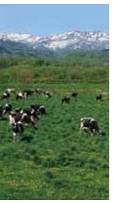
放牧 [黒松内町/2017年5月] 水上 柳子(黒松内町) 牛舎から解放されて嬉しそうな牛。