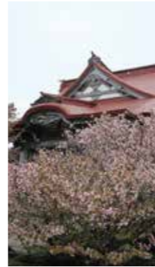
チシマザクラと清隆寺 [根室市/2017年5月] 能登 喬也(札幌市厚別区) 日本の最東端の根室で見ることが出来るチシマザクラです。