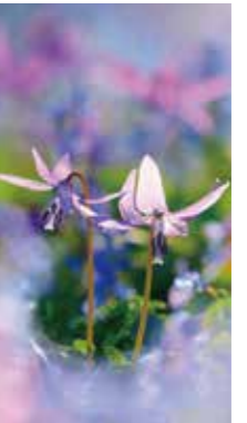
仲良く [浦臼町/2016年4月] 長友 逸郎(札幌市手稲区) 2輪そろって開花。