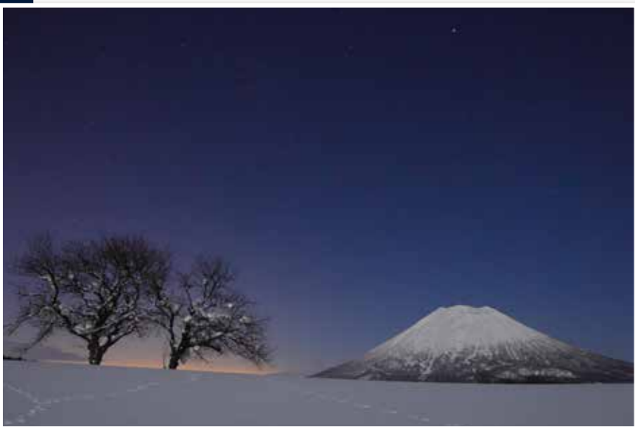
兔の足跡(2月 ニセコ町)