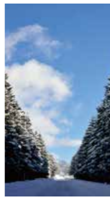
青空の道 [黒松内町/2016年1月] 下村 俊之(黒松内町) 雪の午後、一瞬現れた青空、木々と雪の道、青空のコントラストが美しい。