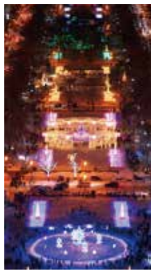
光の宴 [札幌市 大通公園/2016年12月] 大口 雄一(札幌市厚別区) 冬の都心の雪に映える光のページェント。寒さを忘れさせてくれる優雅なひと時を感じました。