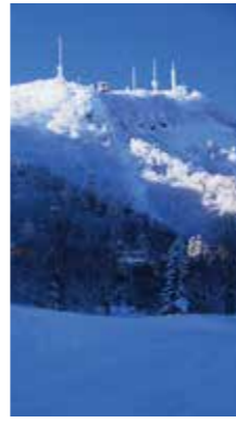
霧氷輝く [札幌市/2017年1月] 原田 芳昭(札幌市西区) 霧氷に覆われた木々が、朝日に輝いていました。