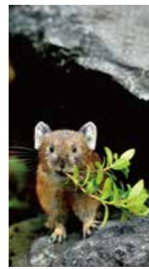
巢作り開始 [美瑛町 十勝岳展望台/2015年8月] 長友 逸郎(札幌市手稲区) ナキウサギが小枝を何回も運んできて、目の前を通り過ぎていった。