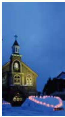
神秘的あかり [小樽市/2017年2月] 近藤 俊六(江別市) 教会と「雪あかり」の風景がとても神秘的に見え、感動しました。