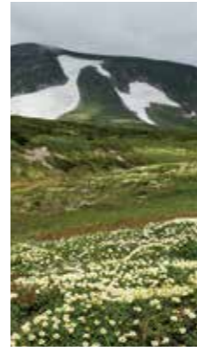
大雪山の夏 [上川町 大雪山 雲ノ平 2016年6月] 釜澤 まつみ(札幌市白石区) チングルマのお花畑と北嶺岳の残雪アート。