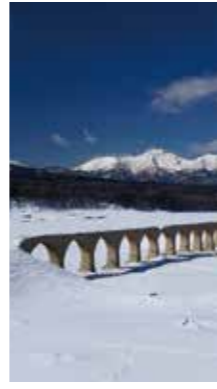
雪原のアーチ橋 [札幌市 ぬかびら源泉郷/2017年2月] 十勝晴れの雪原にたたずむタウシュベツ川橋梁とニソベツ山が印象的だった。