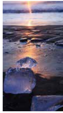
厳冬の朝 [豊頃町/2016年1月] 佐々木 功(札幌市厚別区) 冷え込んだ朝、海岸の砂浜には氷片が打ち上げられていました。