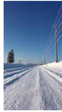
真冬の道 [長沼町/2017年2月] 能登 喬也(札幌市厚別区) 寒さで電柱や木々が凍りついていました。