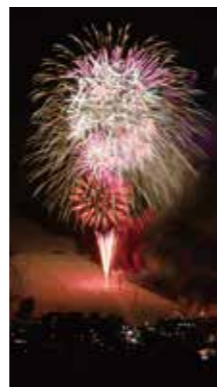
冬の華 [倶知安町/2017年1月] 下村 俊之(黒松内町) 比羅夫のたいまつ消走のあとに打ち上げられた花火。グレンデに咲く花火も、夏と景色を異にしており綺麗でした。