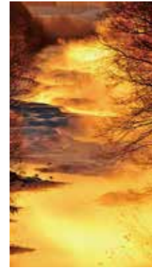
燃える朝 [千歳市/2017年1月] 芳賀 茂俊(恵庭市) 日の出と共に凍てつく小川の中州が黄金色に輝く。