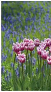
紫の誘惑 [札幌市 百合が原公園/2016年5月] 細川 哲男(札幌市豊平区) 気品を感じてカメラに向けた1枚。