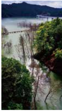
変わり行く風景 [夕張市/2016年9月] 平 正男(札幌市西区) 夕張岳へ続く道。大夕張鉄道が通っていた橋梁。時代と共に姿を変えて残り続ける景色に歴史を感じます。