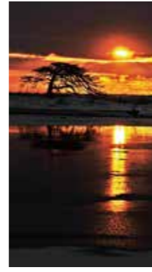
本別海の本松 [別海町/2017年2月] 芳賀 茂俊(恵庭市) 雲間から朝日が顔を出す。オンロワシが来て欲しいと願うが、願い叶わず。