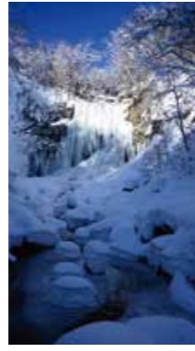
氷瀑沈静 [札幌市 滝野すずらん丘陵公園/2017年1月] 狩野 隆(札幌市豊平区) 「日本の滝百選」に選ばれたアシリベツの滝も厳しい寒さで凍りついていました。