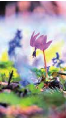
春の妖精 [浦臼町/2015年4月] 平 正男(札幌市西区) 雪が溶けて暖かくなってきた頃、数日間だけ舞い降りる妖精のような姿に感動。