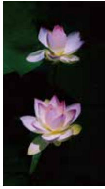
最北のスイレン [札幌市/2016年8月] 松井 繁男(別海町) 今年は赤い花が少なかったそうです。