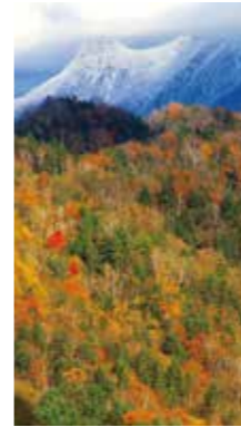
うつろう季節 [夕張市/2014年11月] 中澤 美津子(札幌市厚別区) 季節の変わり目。山には冬と秋が混在する。