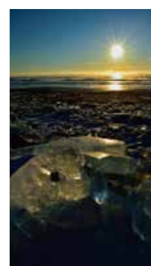
厳冬の輝き [豊頃町/2016年1月] 坂口 哲裕(石狩市) 凍える朝、気風の海岸で朝陽に照らされた氷塊が輝いていました。