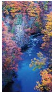
晩秋の渓谷 [札幌市/2016年10月] 原田 芳昭(札幌市西区) 渓谷を流れる川の両岸は、晩秋の紅葉で彩られて印象的でした。