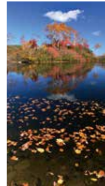
落葉止水 [上川町/2016年10月] 狩野 隆(札幌市豊平区) 大雪高原温泉の小さな沼の水面に浮かぶ落葉が印象的だった。