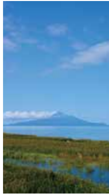
初秋の利尻島 [稚内市/2016年9月] 穴戸 里よ子(札幌市北区) 台風一過。ようやく晴れたオロロオンラインから見た利尻富士が美しかった。