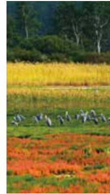
アオサギとさんご草 [佐呂間町 サロマ湖/2016年9月] 長友 逸郎(札幌市手稲区) 水害でさんご草が浸かってしまい、紅葉しない所が多かったが、キムアネツと呼ばれる綺麗な草が咲いた。