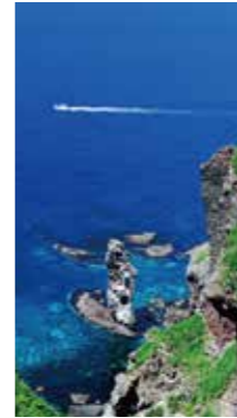
積丹ブルー [積丹町/2016年6月] 長友 逸郎(札幌市手稲区) 快晴で空もきれいな青。こんなに素晴らしい天気になったのは今年初めて。風もなく一日中良い天気だった。