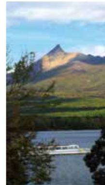
陽を受ける頂 [七飯町/2016年10月] 大口 雄一(札幌市厚別区) 傾きかけた陽を受ける頂は、まっすぐ天を向いて威厳を誇示しているようでした。