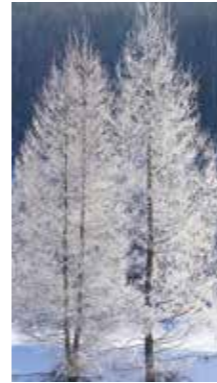
樹霜 [更別村/2016年1月] 中澤 美津子(札幌市厚別区) 見事に凍りついた木は真っ白になり、まるでクリスマスツリーのようだ。