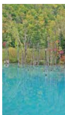
秋色の青い池 [美瑛町/2016年10月] 台風被害から、いつもの青い池に戻っていた。あの雄々しい姿を見ると厳冬を乗り切る気合が入る。