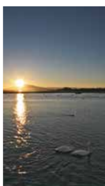
湧沸湖の朝 [網走市 白鳥公園/2016年12月] k.fukumoto(網走市) 斜里岳から知床連山、そして知床岬までの稜線が綺麗に見えた日。斜里岳から登る陽光に照らされて白鳥も一段と綺麗でした。