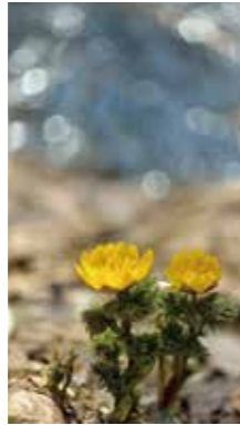
デュエット [札幌市/2016年4月] 穴戸 里よ子(札幌市北区) 待ちかねた春の使者。小川のそばで歌をうたっているようです。