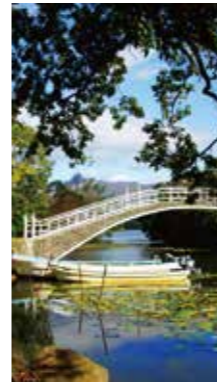
和の風情 [七飯町 大沼国定公園/2016年10月] 大口 芳子(札幌市厚別区) 秋の晴れた朝、江戸時代へのタイムトンネルをくぐったような風景に出会えました。