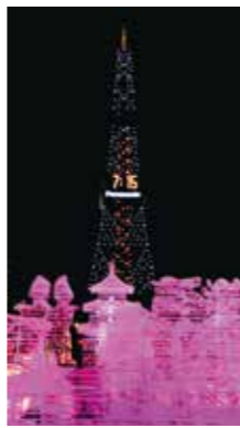
華やかな氷像 [札幌市 大通公園/2016年2月] 船山 晃宏(札幌市手稲区) 華やかにライトアップされた氷像が印象的。

SAPPORO SNOW VISION X Scene 写真投稿コミュニケーションマガジン