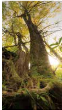
光を浴びて高く [千歳市 美笹/2016年10月] 小助川 卓也(札幌市西区) 雨、風、雪にも動じない。光を浴びて高く、強く、勇ましく。