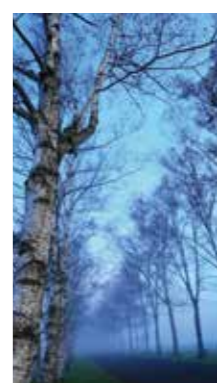
朝もやの白樺並木 [音更町 十勝牧場/2016年10月] 千田 一也(札幌市南区) 朝もやのかかった幻想的な雰囲気表現しました。