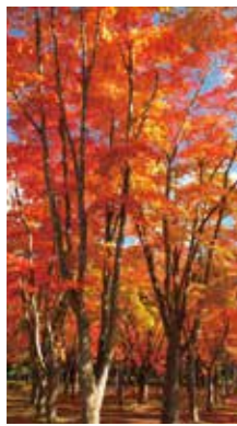
秋の彩り [函館市/2016年10月] 桃井 淳恵(苫小牧市) 整列した幹を大事にして、広角で高さを狙ってみました。